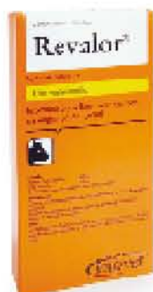
Revalor® Reg. SAGARPA: Q-0273-174

A partir de este peso reimplante con Implemax® para finalizar en pastoreo, o bien, con Revalor® en corral de engorda.